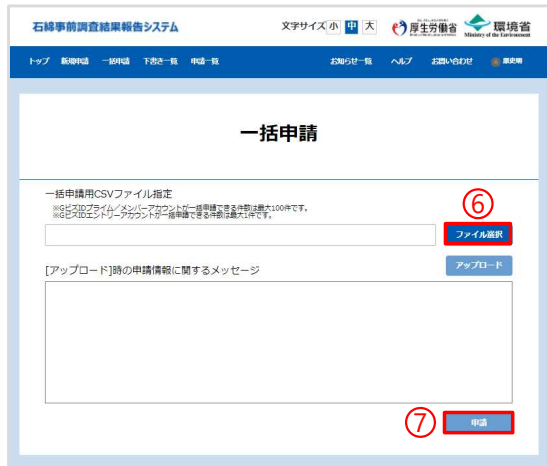
引用元：石綿事前調査結果報告システム ( https://www.ishiwata-houkoku.mhlw.go.jp/shinsei/ )

⑥ 「一括申請」 → 「ファイル選択」をクリック、前ページでダウンロードしたCSVファイルを選択、アップロードをクリック。