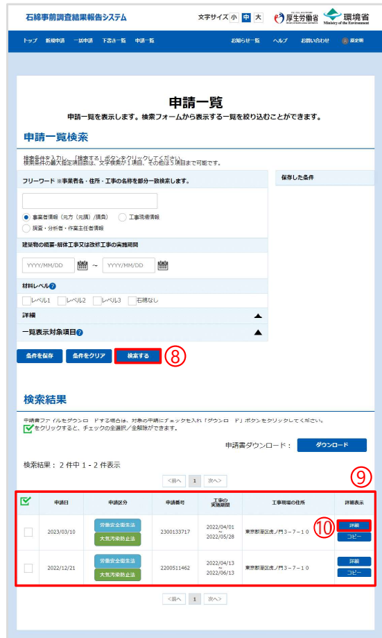
引用元：石綿事前調査結果報告システム ( https://www.ishiwata-houkoku.mhlw.go.jp/shinsei/ )